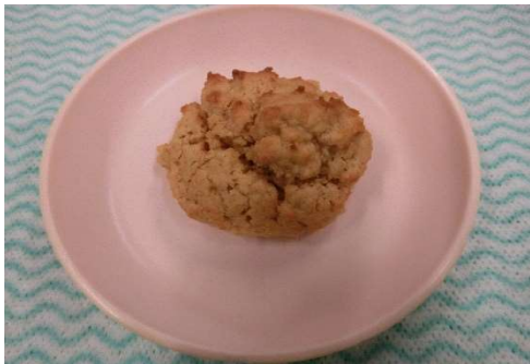
(3じのおやつ) おからマフィン