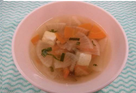
おたんじょう会 ゆで野菜 のっぺい汁