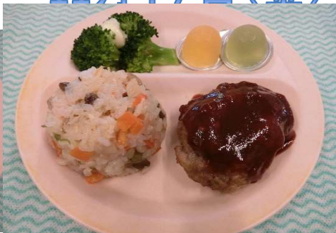
(おひるごはん) きのこごはん 煮込みハンバーグ