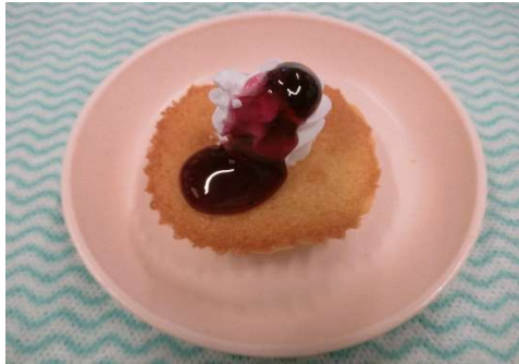
(3じのおやつ) お誕生ケーキ